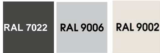
Colors estandarditzats per al disseny exterior

Els revestiments exteriors, i la resta d'elements visibles des de l'exterior, hauran de ser del color RAL 9002.